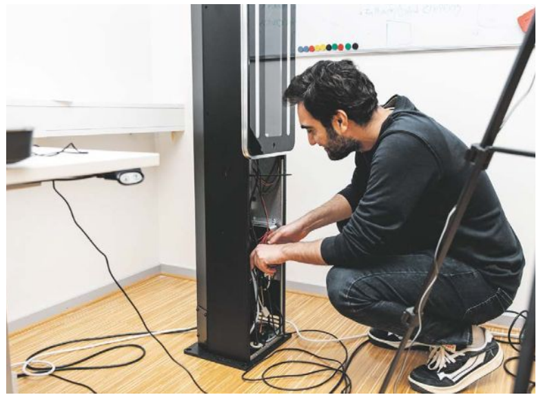
Speed Identity utvecklar framtids säkra lösningar för biometrisk säkerhet.